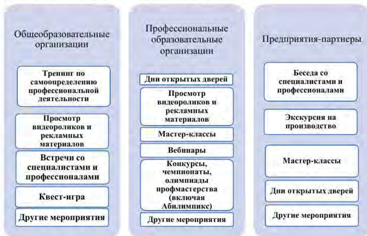
Рис. 2. Основные мероприятия профориентации обучающихся с ограниченными возможностями здоровья и инвалидностью

профессионального образования, в том числе и непосредственно работодателями, которые могут предоставить непосредственное и четкое представление о профессиональной деятельности. Таким образом, можно представить мероприятия по профориентации лиц с инвалидностью и ОВЗ в следующем виде (см. Рис 2.):