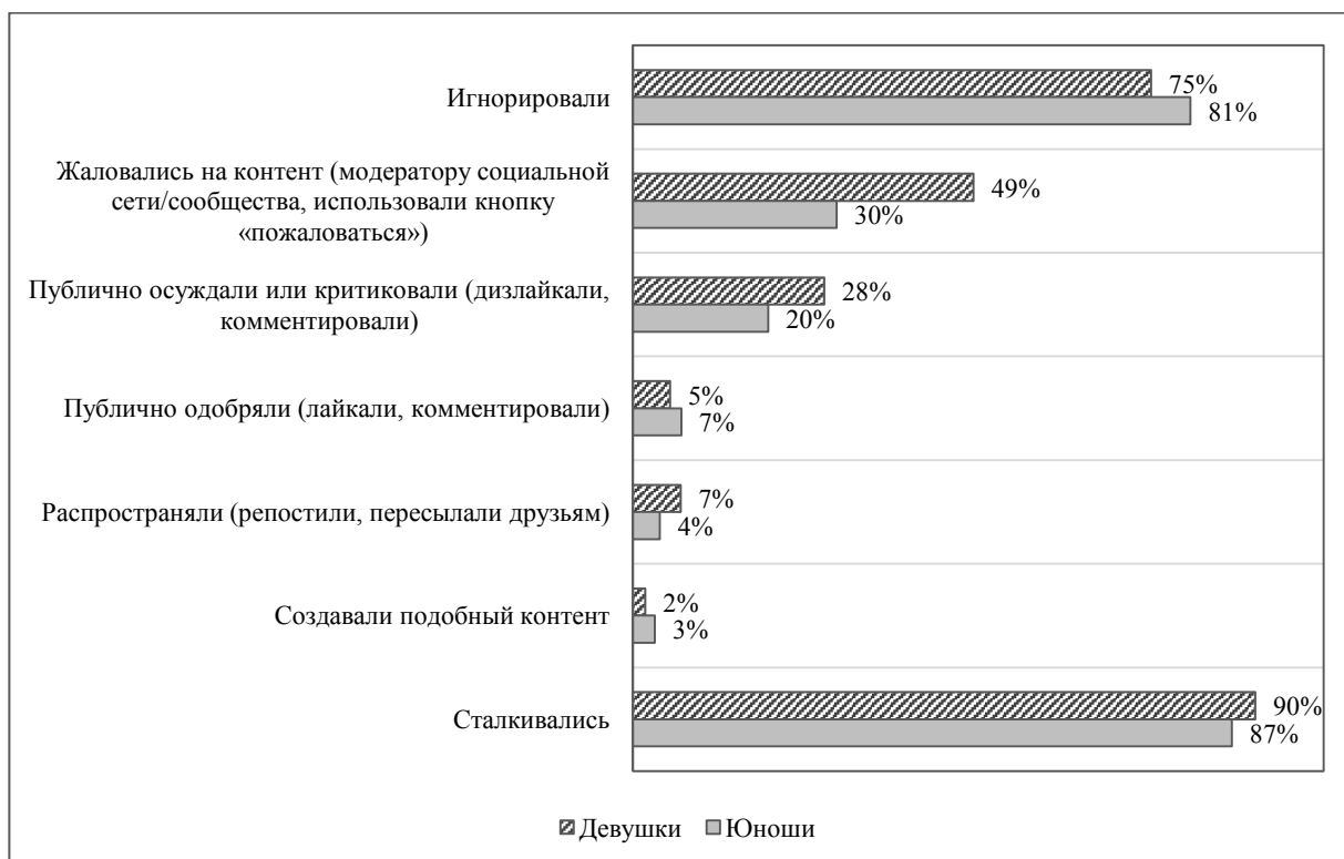
Рис. 3. Столкновение подростков и молодёжи 14-25 лет разного пола с негативным контентом и реакция на него (2021 г.)

Для проведения упражнения ведущий предлагает участникам разделить на подгруппы по 3-5 человек. Участникам каждой подгруппы предлагается выбрать какую-нибудь социальную сеть и с помощью личных гаджетов изучить ее правила и инструменты, которые пользователь данной социальной сети может использовать для фильтрации нежелательного контента. Участники фиксируют результаты своего исследования на листе ватмана.