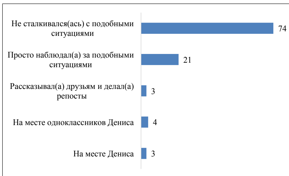
Рис. 1. Столкновение подростков и молодёжи с фейковой информацией, %

По данным исследования большинство (74%) подростков и молодёжи никогда не сталкивались с фейковой информацией, которая приводила к каким-либо неприятным последствиям для них. С такими ситуациями сталкивалась четверть подростков и молодёжи, и 21% наблюдали за ними со стороны. На месте тех, кто пострадал от фейковой информации, оказывались от 3% до 4% подростков и молодёжи. Такой же процент респондентов были распространителями недостоверной информации в сети (рис. 1).