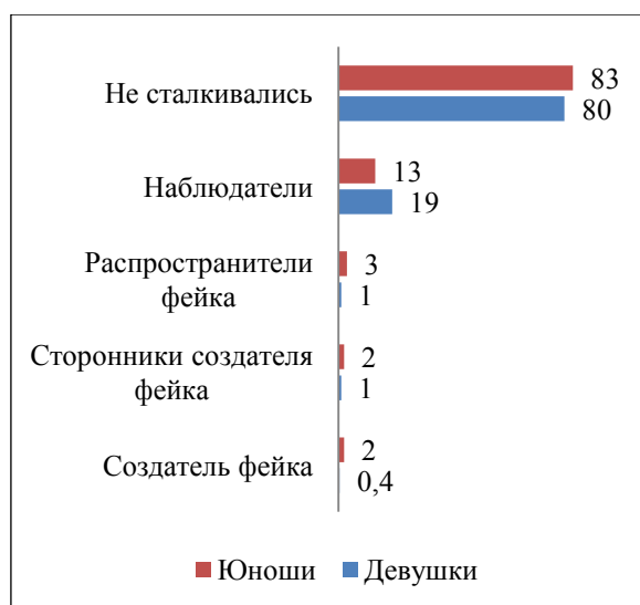
Рис. 3. Столкновение девушек и юношей с фейками как рисками для репутации в разных ролях, %

Какие основные рекомендации по распознаванию фейков и защиты от недостоверной информации дают сегодня практики и ученые? Приведем основные из их большого количества.